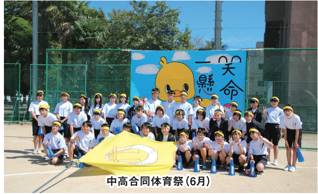
中高合同体育祭(6月)