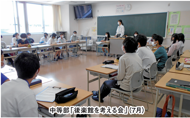
中等部「後楽館を考える会」(7月)