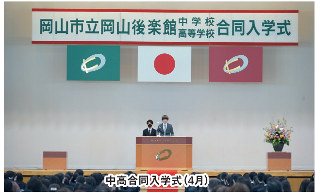
中高合同入学式(4月)