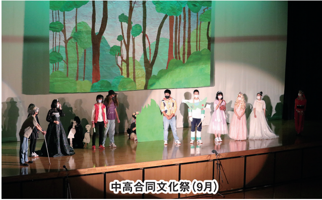
中高合同文化祭(9月)