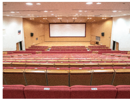
理大ホール 文化祭やプレゼン発表会、また講演会などはこの理大ホールで行います。音響・照明など専門設備も整っています。