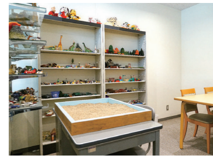
教育相談室 スクールカウンセラーが教育相談室にいますので、思春期の悩みを相談できます。誰でも気軽に利用できます。