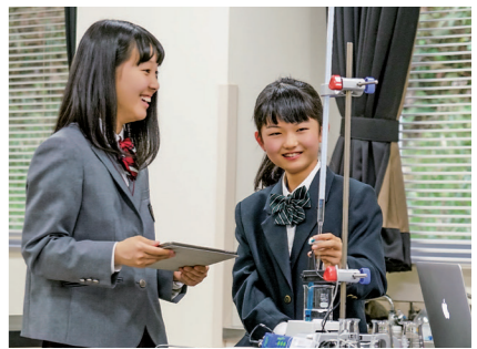
高度な各種実験室 専門的な実験や研究を行うことができる研究室があります。自ら設定した課題研究に取り組んでみましょう。