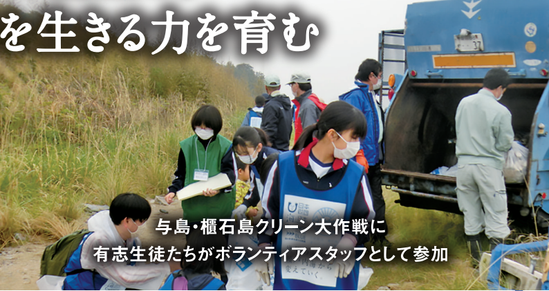
与島・櫃石島クリーン大作戦に 有志生徒たちがボランティアスタッフとして参加