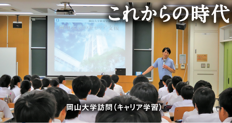
岡山大学訪問(キャリア学習)